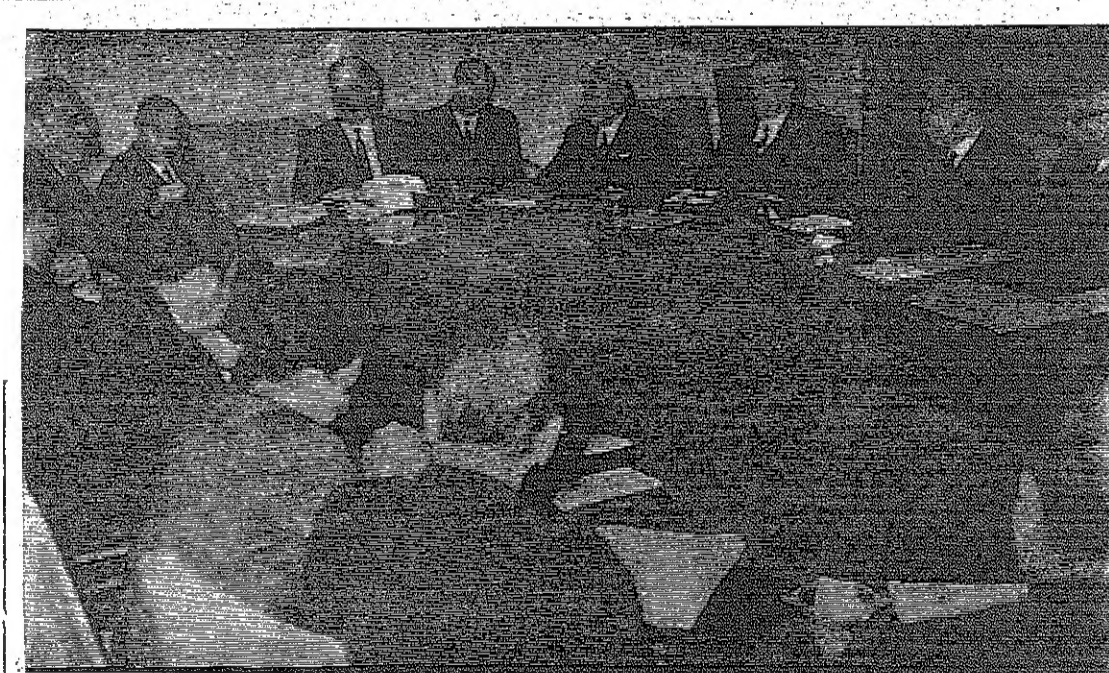
جلالة الملك المعظم يترأس اجتماع مجلس الوزراء